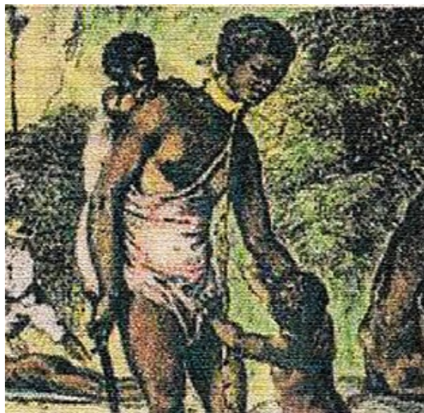
Polonia. En 1581 organizó en Malambo (Bolívar) un grupo de 150 palenqueras que derrotó al capitán Pedro Ordóñez Ceballos. Tras el enfrentamiento, pactó la paz a cambio de tierras y de la libertad de su 'ejército'. Pero Ordóñez violó el pacto y le tendió una trampa. Los historiadores la identifican como uno de los símbolos patrios de la mujer afrodescendiente en la lucha popular. http://www.colarte.com/colarte/foto.asp?idfoto=287050

deben mencionarse la reforma a la educación superior, así como los proyectos de reforma al estatuto minero y de ley general agraria y de desarrollo rural. En el primer caso, la masiva movilización estudiantil y ciudadana dio al traste con las pretensiones de privatización y mercantilización extrema, obligando al gobierno a retirar el proyecto. El propósito de debilitar la educación superior pública continúa por otras vías, principalmente a través de la desfinanciación, que genera presiones crecientes para la generación de recursos propios.