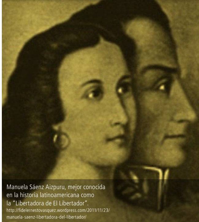
Manuela Sáenz Aizpuru, mejor conocida en la historia latinoamericana como la "Libertadora de El Libertador". http://fidelernestovasquez.wordpress.com/2011/11/23/manuela-saenz-libertadora-del-libertador/

La clave en este caso parece estar en las definiciones de la predominante facción financiera transnacionalizada. ¿Considera agotada su alianza con la facción terrateniente-ganadera, criminal y mafiosa, que le permitió consolidar su poder a partir de una desestructuración violenta del campo popular y de un alistamiento del territorio con fundamento en el despojo y el desplazamiento? ¿Deshace esa alianza y privilegia un proceso de tardía modernización capitalista del mundo rural, para contribuir a ensancharlo de manera más profunda en los agronegocios transnacionales financiarizados? Todo ello,