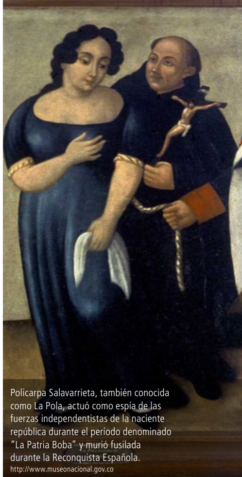
Policarpa Salavarrieta, también conocida como La Pola, actuó como espía de las fuerzas independentistas de la naciente república durante el período denominado "La Patria Boba" y murió fusilada durante la Reconquista Española. http://www.museonacional.gov.co

en una Asamblea Nacional Constituyente, es algo que merece la mayor atención, y debería concentrar los esfuerzos del campo de las clases subalternas.