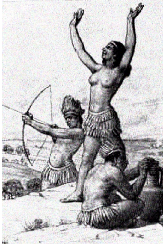
Cacica Gaitana. Fue ella quien lideró en toda la región central de nuestro país un alzamiento general, al que los españoles llamaron "La federación Pijao". En esa guerra, que costó muchas vidas de ambos bandos, ella entregó la suya como una ofrenda por la libertad de los indígenas. http://img.webme.com/pic/h/hotelamericano/lagaaitana.gif

En la legislatura a iniciarse a mediados del mes de marzo, se ha anunciado por parte del gobierno la presentación de dos proyectos de reforma que buscan corregir fracasos de la política neoliberal a través de diseños que tienen como propósito principal perfeccionar el negocio de la salud y de las pensiones, respectivamente. En materia de salud, se pretende una mejor estructuración del mercado, con fundamento en una centralización de los recursos y de las afiliaciones al sistema en cabeza de una institución pública (cuya naturaleza jurídica aún no se conoce), que al parecer debe cumplir funciones similares a las de una fiduciaria, pues administraría los dineros que tendrían que ser transferidos a las nuevas empresas gestoras del servicio, organizadas territorialmente, de acuerdo con los servicios efectivamente prestados. El carácter mercantil del sistema permanece incólume